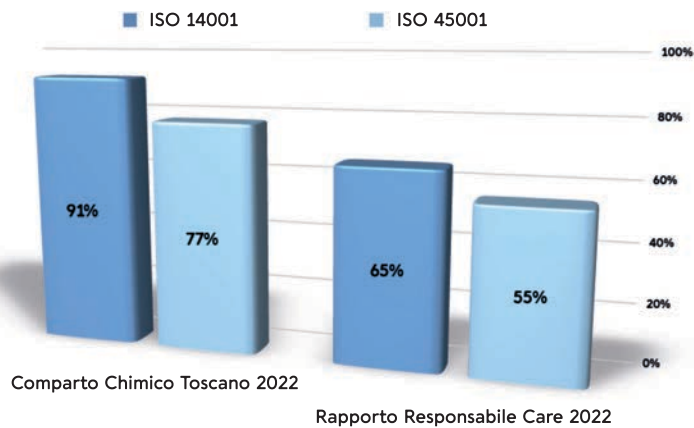
Certificazioni per Salute, Sicurezza e Ambiente (%)